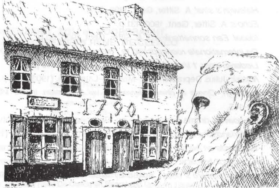
Voorzijde van het museum

René De Clercq werd geboren op 14 nov. 1877. Op diezelfde dag, 118 jaar later in 1995, werd in zijn geboortehuis een pakje met vijf wenskaarten voorgesteld.